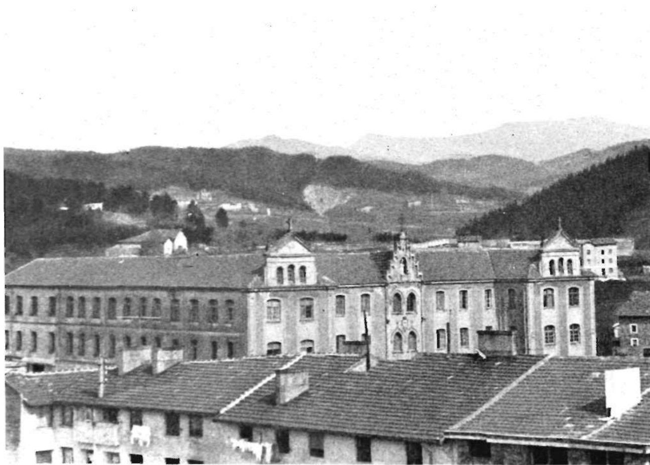
Zornotza'ko Ikastetxea. Urrin, Etxano ta Oiz tontorra