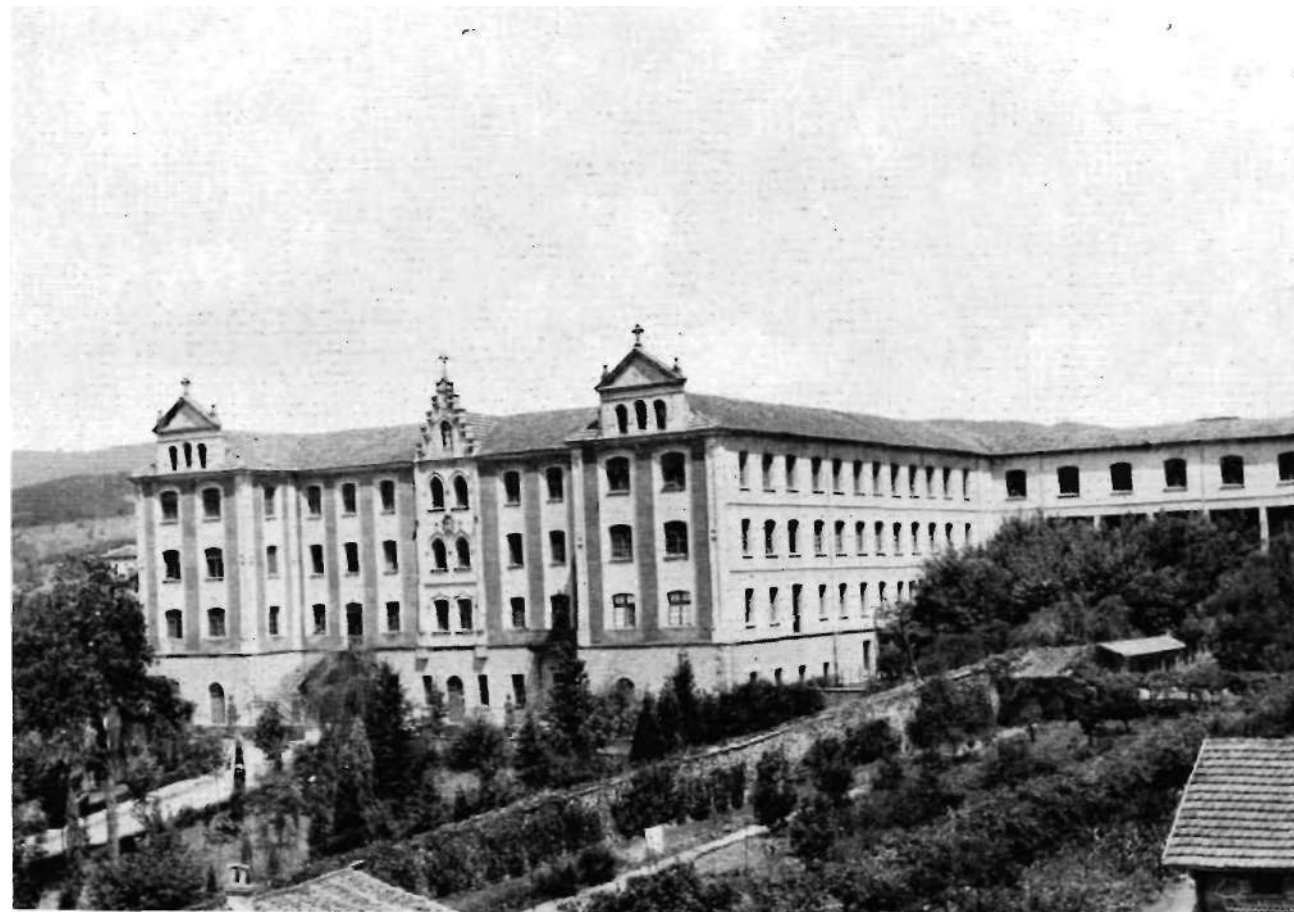
Zomotssa'ko prailletgia. Batxiller irakasten da