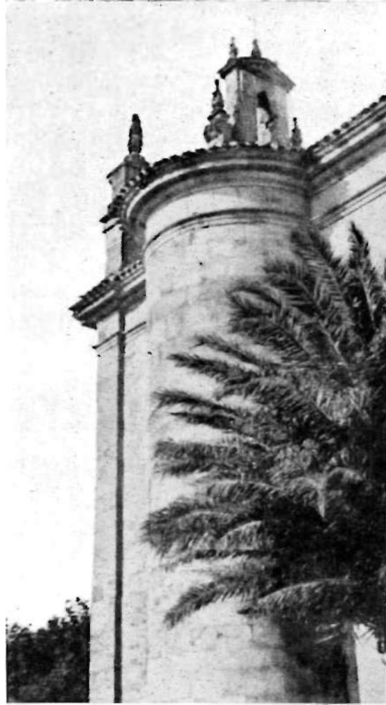
Larra'ko komentua Ategorri'tik eta eleizearen saietsa sarkaldetik