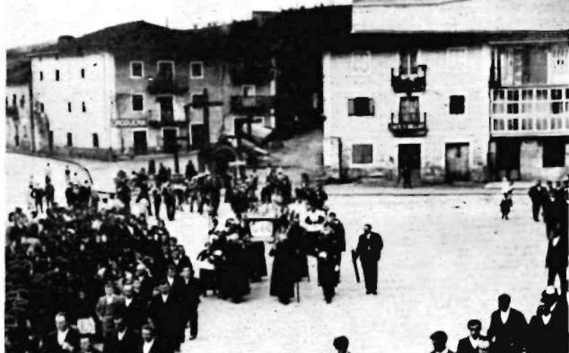
Zornotza'ko eleiz nagusia, Zelaieta'ko iturri zarra ta ibildeun bat