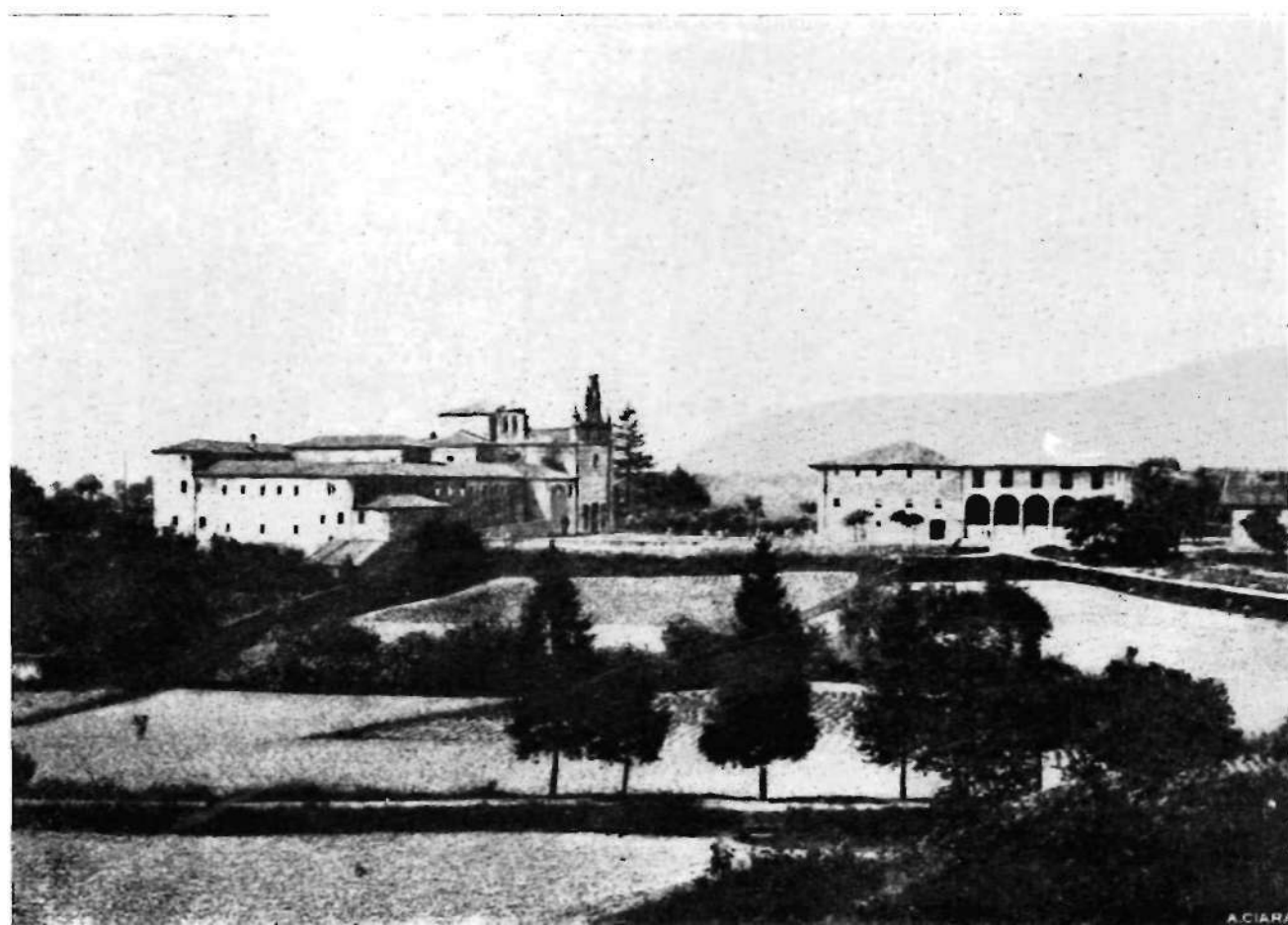
Larra'ko komentua ta jauregia Gernika'rako trenbide ondotik