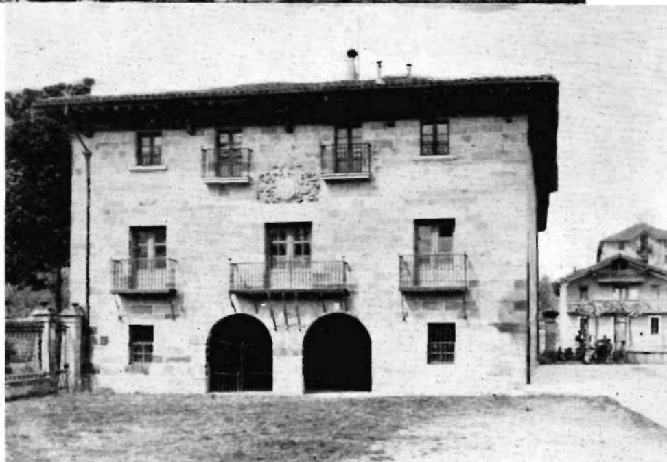
Larra'ko baratza ta jauregia, 1936'ko gerra aurretik