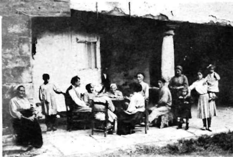
Lopene baserria gaurko Zelaieta'n, andra-gizonen batzarra ta andrak kartetan