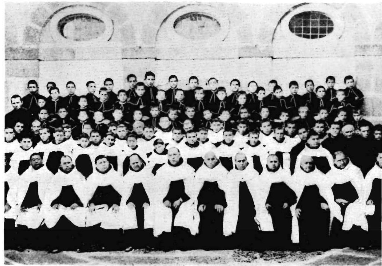
Larra'ko karmeldarrak, 1924'an