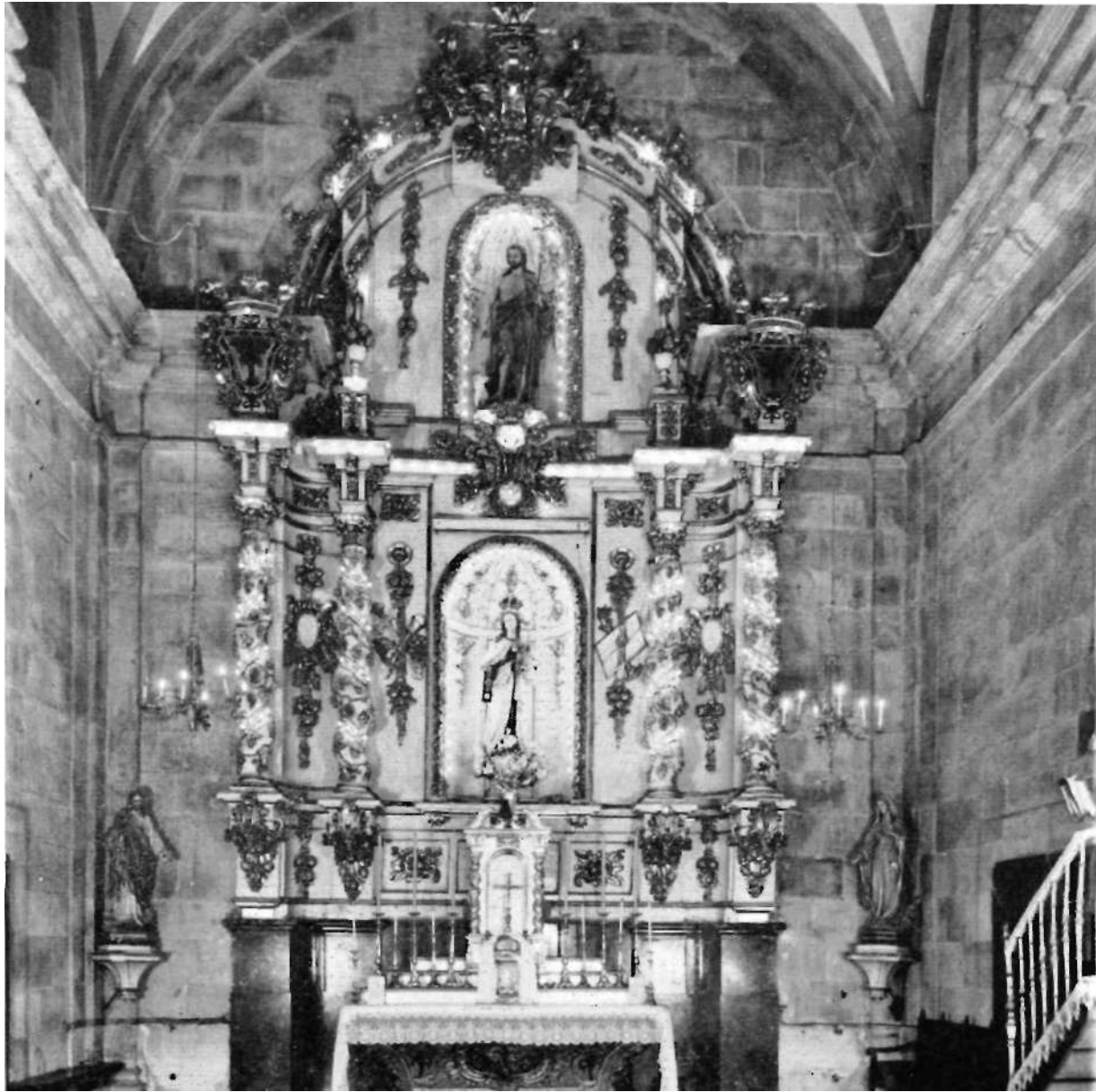
Larra'ko eleizako altara nagusia