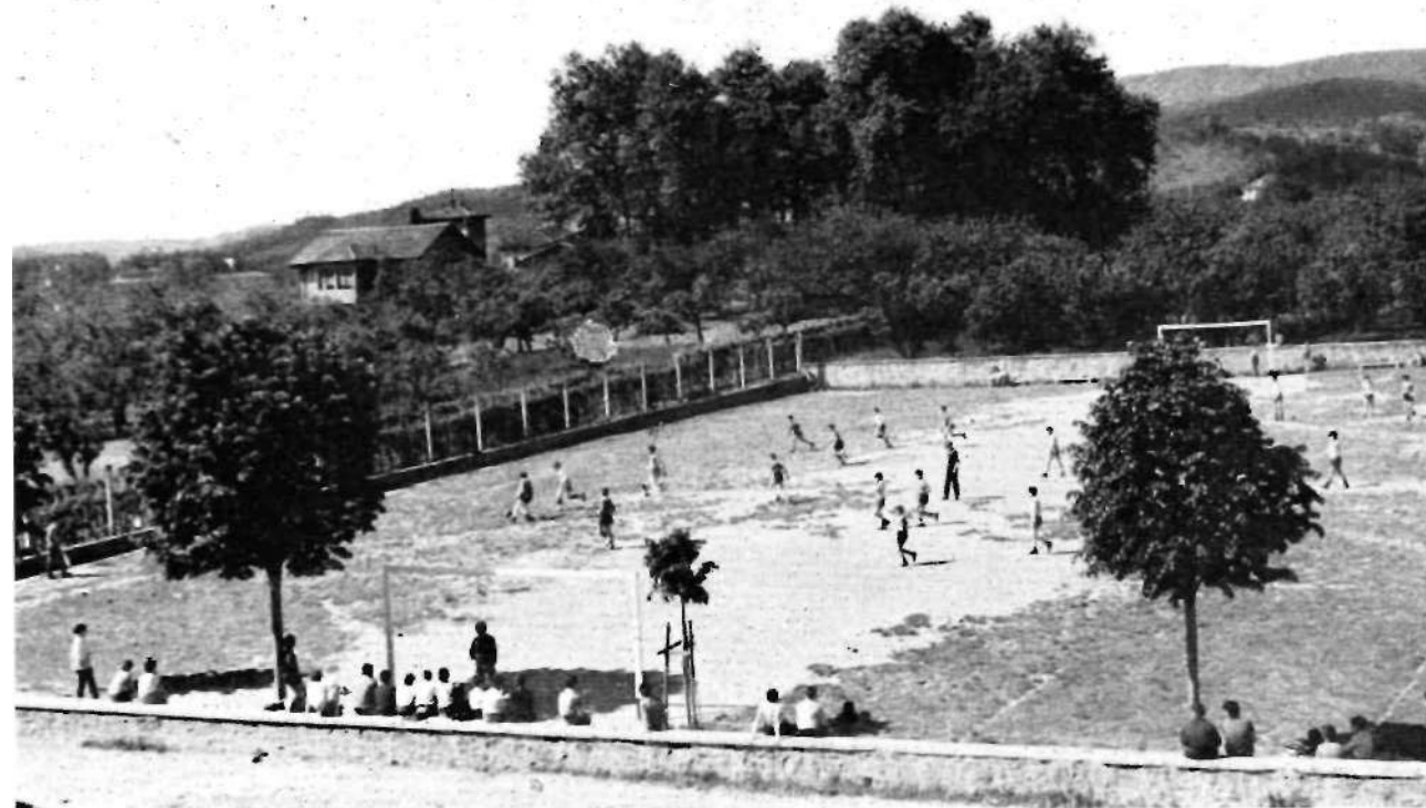
Zornotza'ko karmeldar Ikastetxean batxiller ikasten daberen gazteak Gatzelugatx'en eta bertoko jolastokian