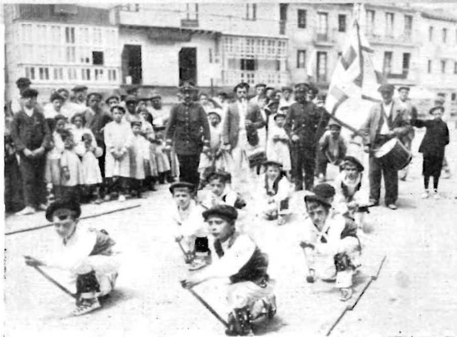
Gerra aurreko aiuntamentua, eta beian euskal jai bat