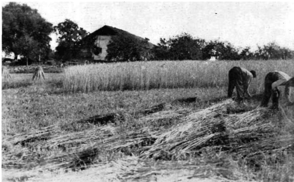
Kortederra'ko bidean Tantorta etxea, ta Ixar aldean gari-ebaten