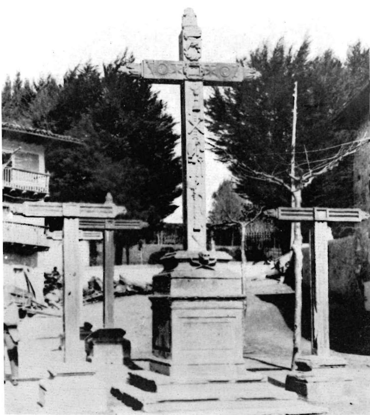
Plazako Kalbario zarra, oindino be zutik dagoana