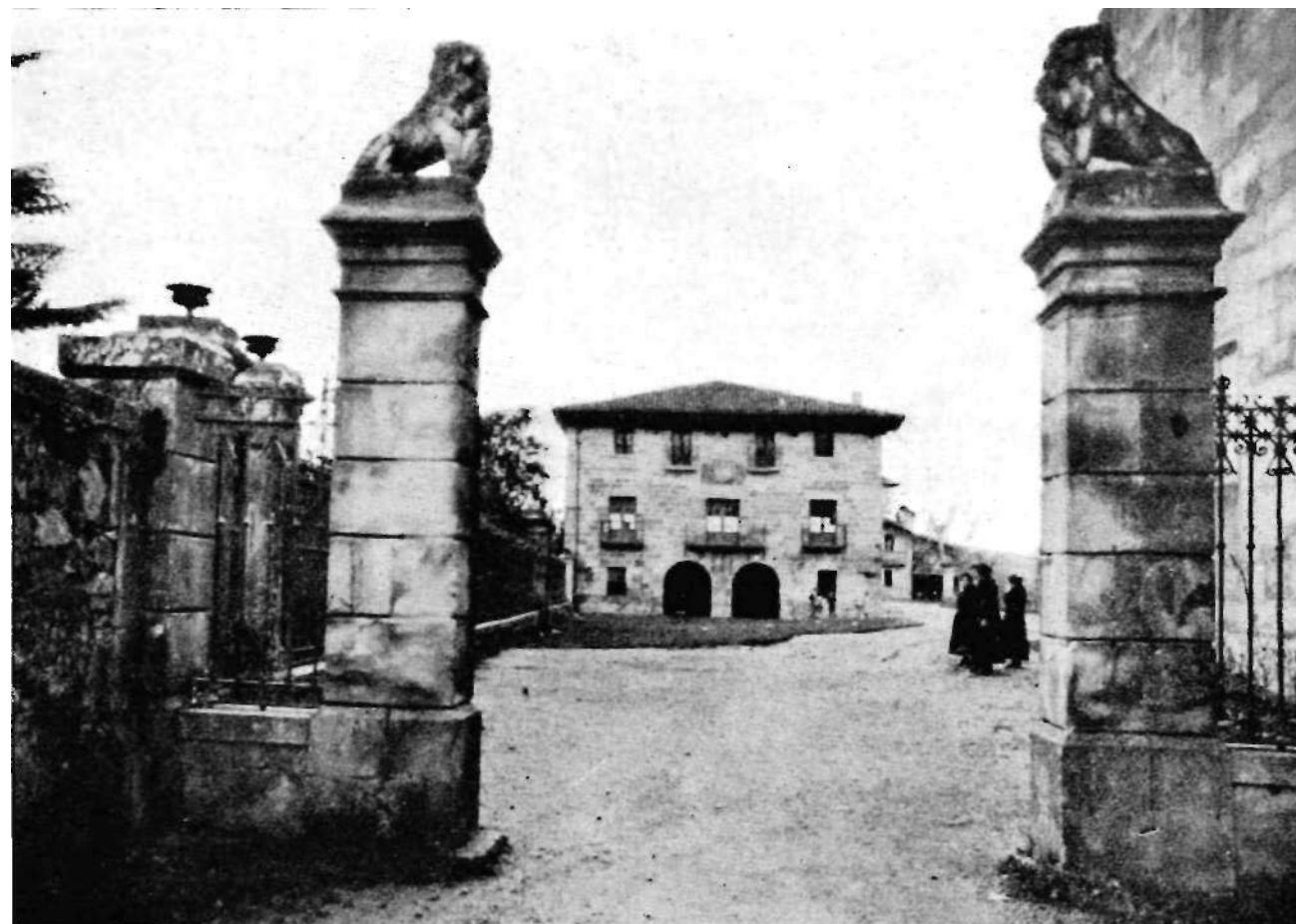
Larrea'ko jauregia, antxiña egoan lez