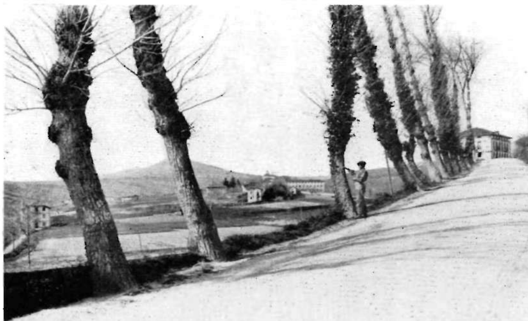
Goian, Ixar aldeko txopoak. Beian, Arnabate, Autzagane'rako bidean